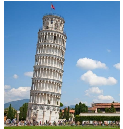
Highlight ! หอเอนปิซ่าเคยเป็นสถานที่กาลิเลโอมาพิสูจน์เรื่องแรงโน้มถ่วงของโลก