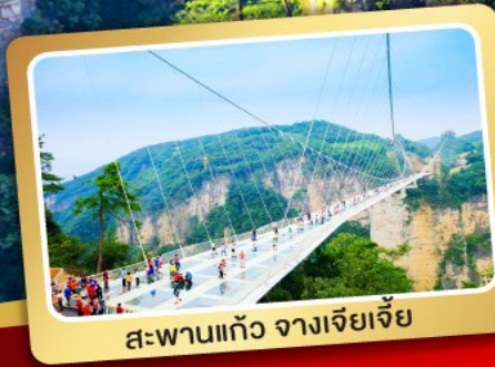
สะพานแกว่ง จางเจียเจีย