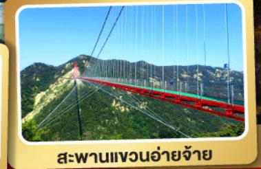
สะพานแวงนอ้ายจ้าย