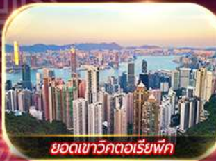
ยอดเขาวิกตอเรียพีค