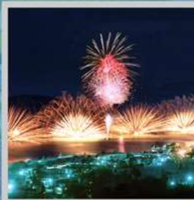
"TOYA FIREWORK FESTIVAL"