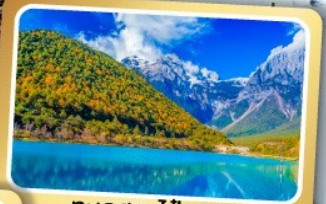
ทะเลสาบปู้สยู่เหอ