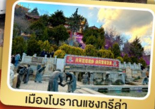
เมืองโบราณแซงกรีล่า