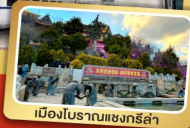
เมืองโบราณแชงกรี่ล่า