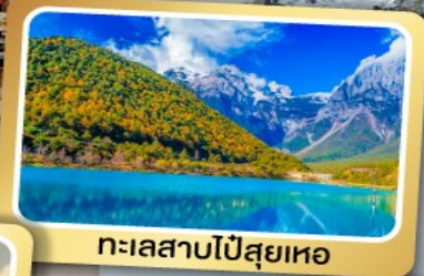
ทะเลสาบไป๋สยู่เหอ