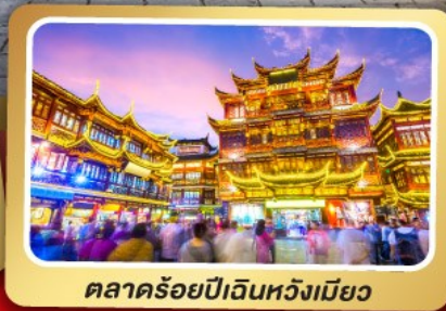
ตลาดร้อยปีเงินหวงเมี่ยว