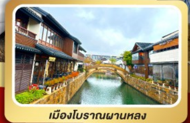
เมืองโบราณผานหลง