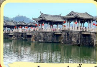
• สะพานโบราณกว่างจี้