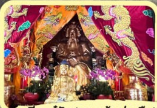
• เอียงบู๊ซิว (ศาลเจ้าพ่อเสือ)