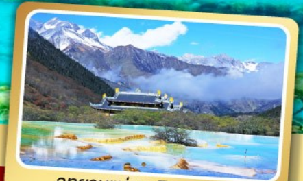
อุทยานแห่งชาติหลงหล่ง