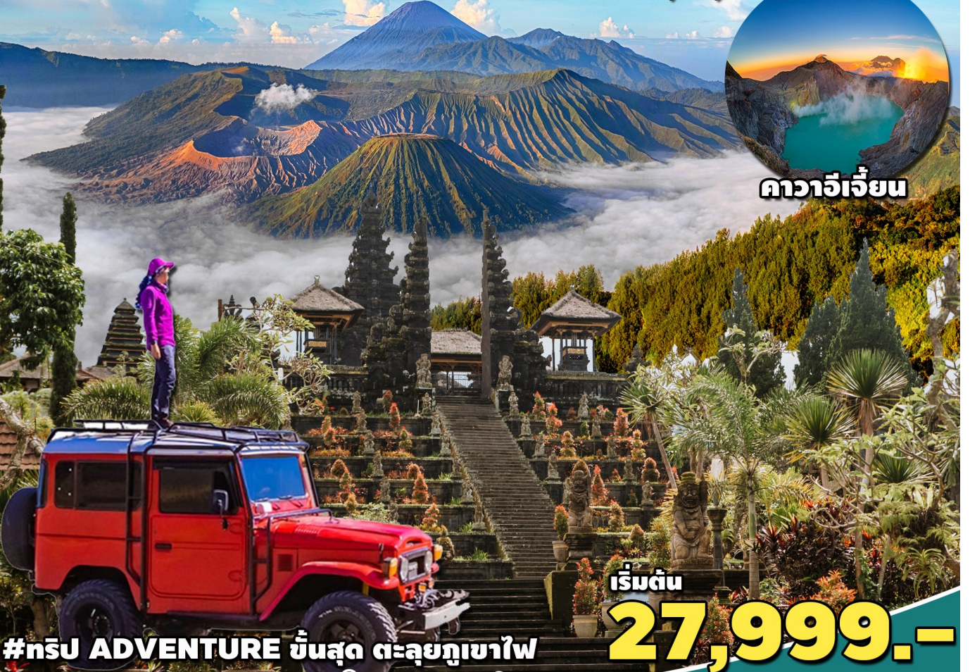
ควาจิเจียน