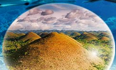
CHOCOLATE HILLS เกาะโบโฮล