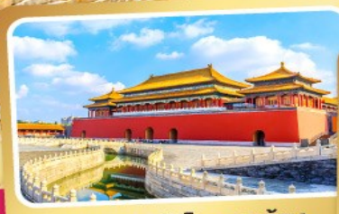
พระราชวังโบราณปักกิ่ง