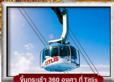
ขึ้นกระเช้า 360 องศา ที่ Titlis