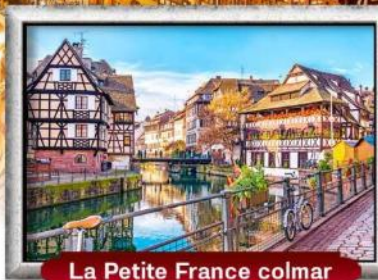
La Petite France colmar

บินหรู สายการบิน Full Service | พิเศษ! หอยเอสคาโก้