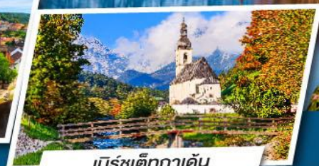
เบิร์ชเต็กกาเดิน