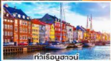
ท่าเรือบูฮาวน์

เดินทาง 07-14, 17-24 ก.ย. 67 08-15, 16-23 ต.ค. 67