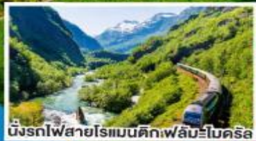
นั่งรถไฟสายโรแมนติกเฟลัมโบคริส