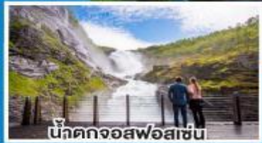
น้ำตกจอสฟอสเซน