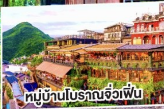
หมู่บ้านโบราณจื่อเฟิน