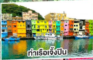
ท่าเรือจิ้งปิ่น