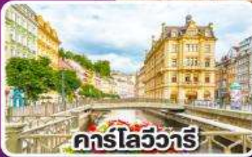
คาร์โลวารี