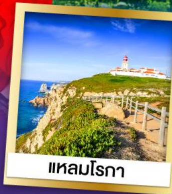
แหลมโรกา