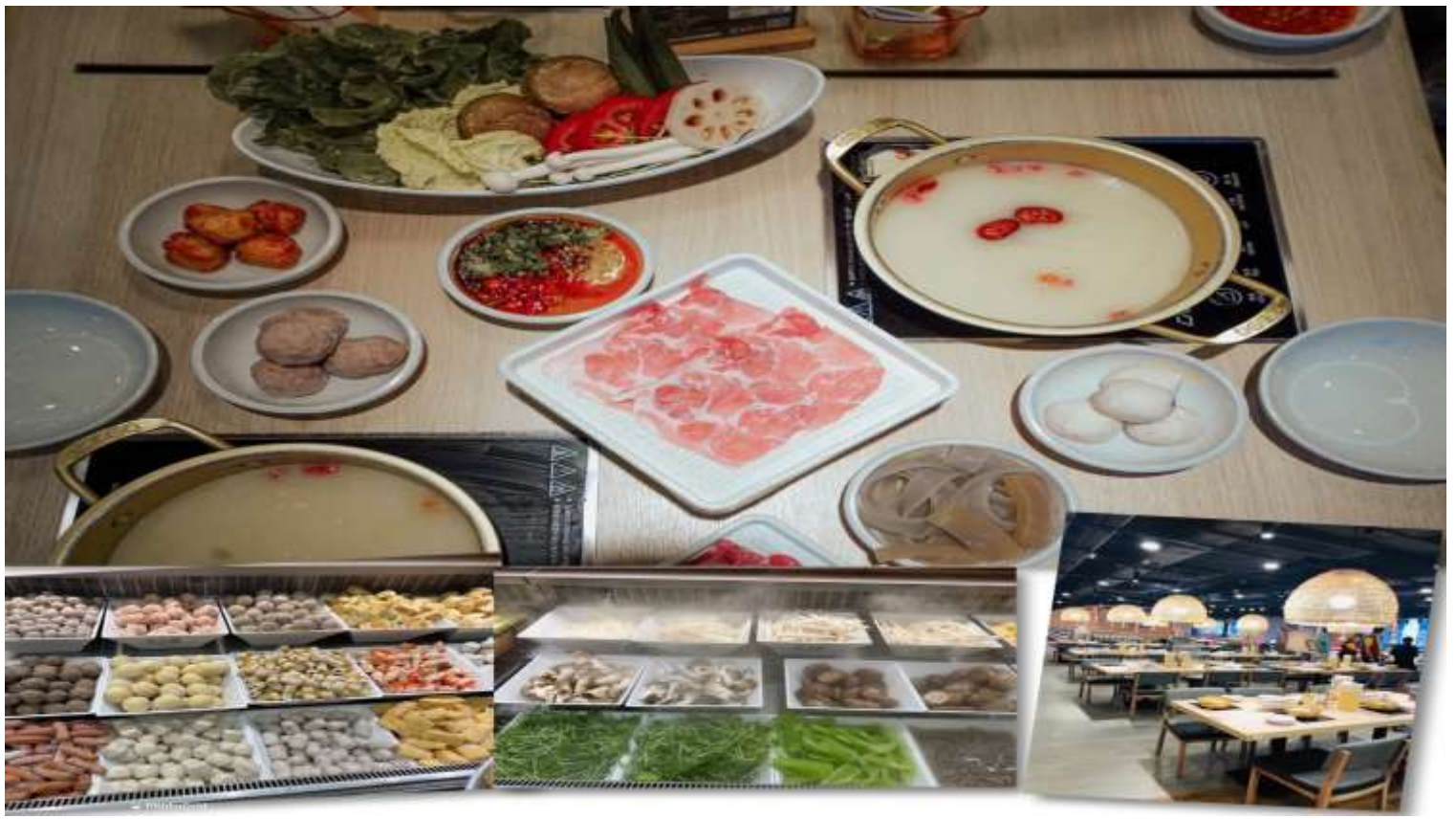
เที่ยง รับประทานอาหารเที่ยง 101 (3) เมนูชาบู