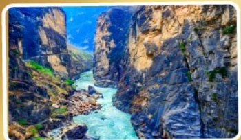
ช่องแคบเสีอกระโจน