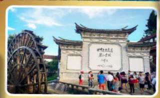
เมืองกำลังเจียง