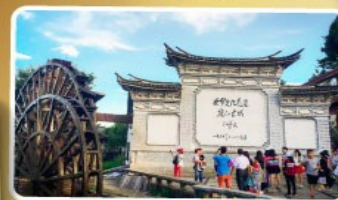
เมืองเก่าลี่เจียง