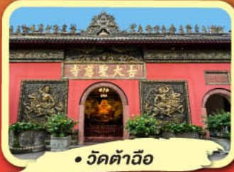
• วัดต้าฉี