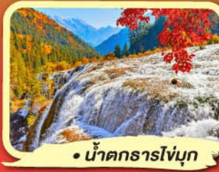
• น้ำตกธารโง่บู

เดินทาง 11-16 ก.ย. 67 24,900.- 13-18 ก.ย. 67 25,900.-