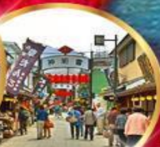
ย่านโบริราด ชิบูยะ