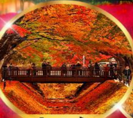
อุโมงค์เมเปิ้ล