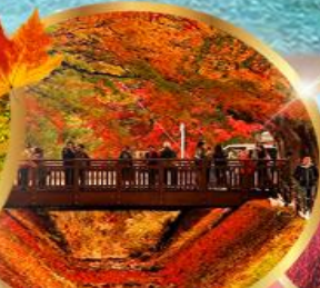
อุโมงค์เมเปิ้ล