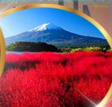
โออิชิ พาร์ค