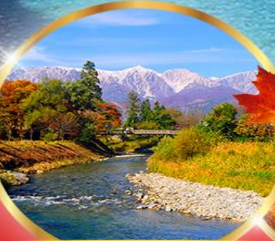
โออิเดะ พาร์ค