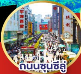
ถนนชุนชี่ลู่