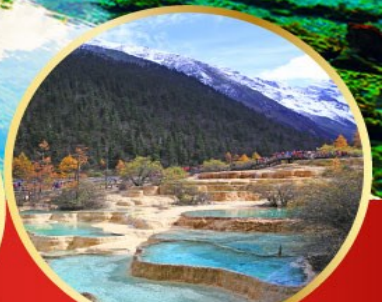
อุทยานหลวงหลง