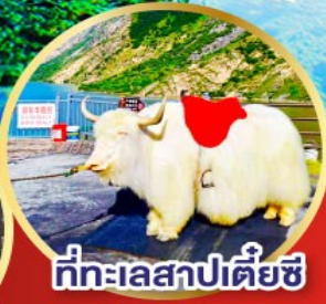
ที่ทะเลสาปเตี้ยชี่