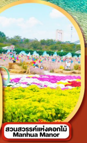
สวนสวรรค์แห่งดอกไม้ Manhua Manor