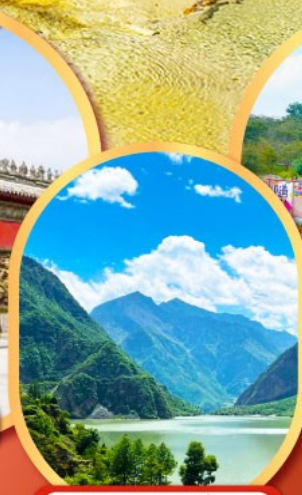
ทะเลสาปเต๋ยซี