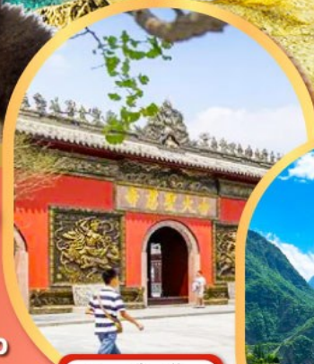
วัดต้าฉิว