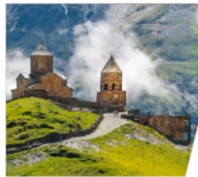
โบสถ์เกอร์เกติ