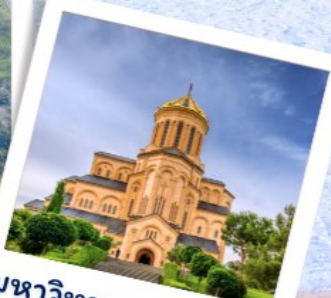
มหาวิหารแห่งทบิลีซี