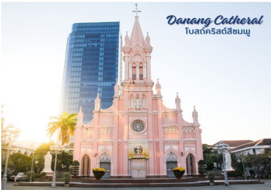
Danang Cathedral โบสถ์คริสต์สีชมพู

นำท่านถ่ายรูป โบสถ์คริสต์ดานัง หรือโบสถ์คริสต์สีชมพู (Danang Cathedral) สร้างขึ้นสมัยเวียดนามตกเป็นอาณานิคมของฝรั่งเศส สถาปัตยกรรมสไตล์โกธิก ยตกแต่งด้วยความประณีตสวยงาม ตัวโบสถ์เป็นสีชมพูทั้งหลัง ตัดขอบด้วยสีขาว เป็นอีกหนึ่งสถานที่ที่ไม่ควรต้องพลาดเมื่อมาเยือนเมืองดานัง จากนั้น อิสระช้อปปิ้ง ตลาดฮาน อิสระเลือกซื้อสินค้าหลากหลายชนิด เช่นผ้า เหล้า บุหรี่ และของกินต่างๆ เป็นตลาดสดและขายสินค้าพื้นเมืองของเมืองดานัง