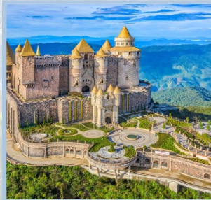
ปราสาทจันตรา