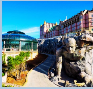
โซน Eclipse Square