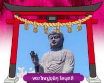
พระใหญ่อุซึคุ โดบุคสึ

เดินทางโดย สายการบินแอร์เอเชียเอ็กซ์ อาหาร : 6 มื้อ โรงแรม : 3 คาว