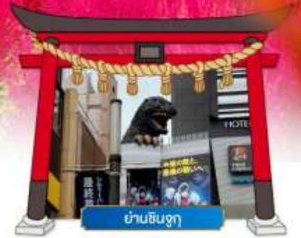
ย่านชินจูกุ

เดินทางโดยสารการบิน : ไทยแอร์เอเชียเอ็กซ์