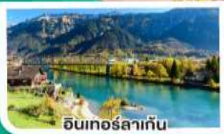
อินเทอร์ลาเก็น