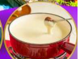
ฟองดูซีส