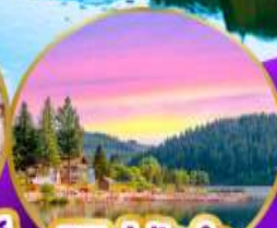
ททิเซ่ ปาด้า