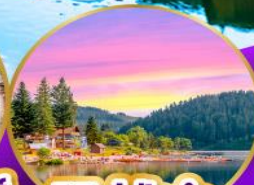
ทิกิเซ่ ปาด้า