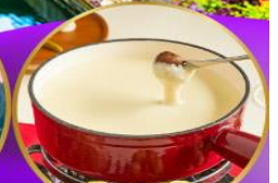
ฟองคูชีส