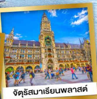
จัตุรัสมาเรียนพลาสต์