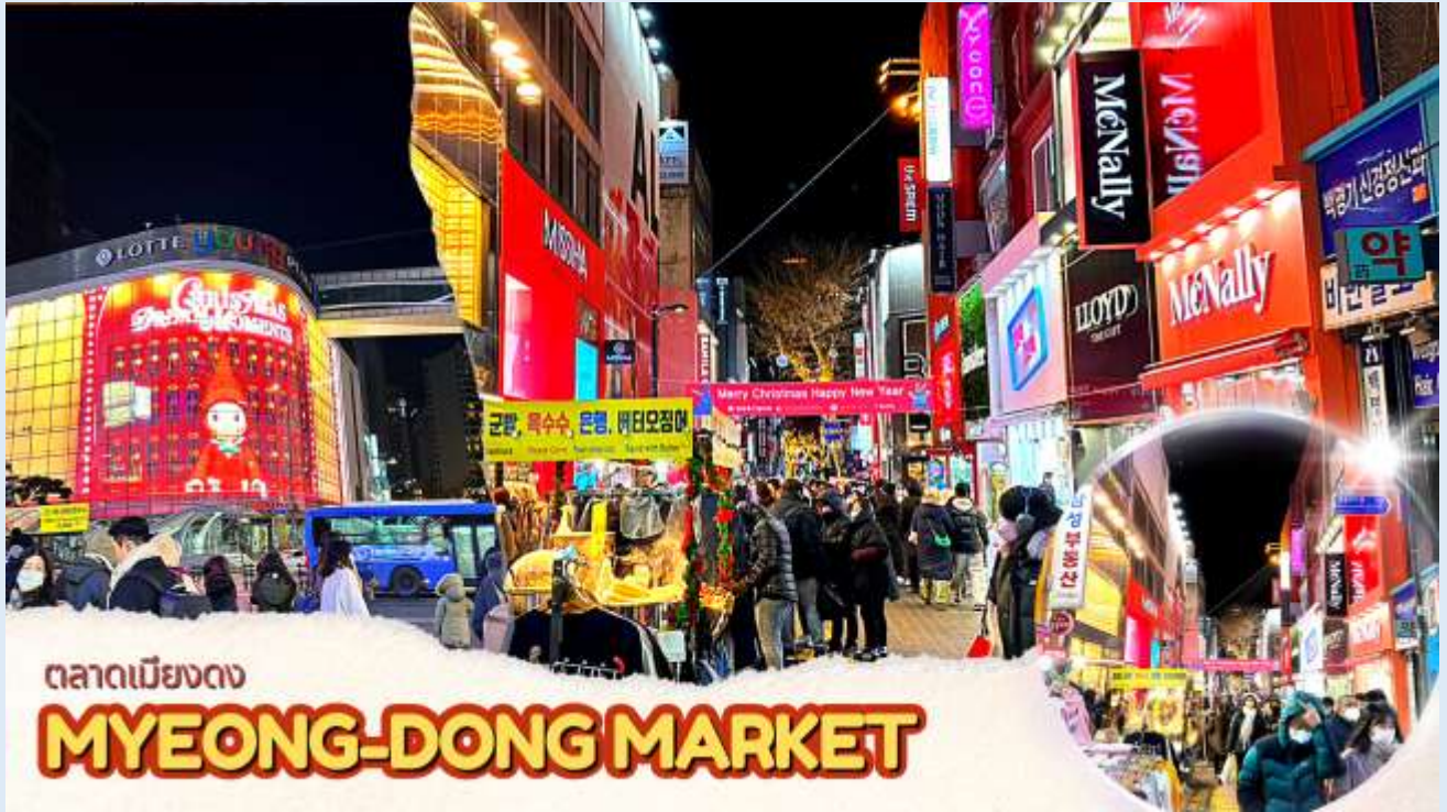
ตลาดเมียงดง MYEONG-DONG MARKET

จากนั้นนำท่านช้อปปิ้งย่าน เมียงดง หรือสยามสแควร์เกาหลี หากท่านต้องการทราบว่าแพชั่นของเกาหลีเป็นอย่างไร ก้าวล้ำทันสมัยเพียงใดท่านจะต้องมาที่เมียงดงแห่งนี้ พบกับสินค้าวัยรุ่น อาทิ เสื้อผ้าแฟชั่นแบบอินเทรนด์ เครื่องสำอางต่าง ๆ ของเกาหลี พบกับความแปลกใหม่ในการช้อปปิ้งอีกรูปแบบหนึ่ง ซึ่งเมียงดงแห่งนี้จะมีวัยรุ่นหนุ่มสาวชาวโสมไปรวมตัวกันที่นี้กว่าล้านคนในแต่ละวัน