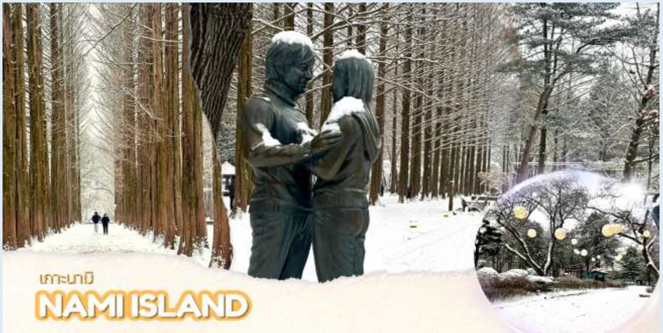
เกาะนามิ NAMI ISLAND

เที่ยง บริการอาหารเที่ยง ณ ร้านอาหาร (มื้อที่ 1) บริการ หาคาลบี้ หรือไก่บาร์บีคิวผัดซอสเกาหลีอาหารเลี้ยงชื่อของเมืองซุนซอน โดยนำไก่บาร์บีคิว มันหวาน ผัดกะหล่ำปลี ต้นกระเทียม ต็อกหรือข้าวปั้น และซอสผัดรวมกันบนกระทะแบนดำคลุกเคล้าทุกอย่างให้เข้าที่ รับประทานกับผักกาดเกาหลีและเครื่องเคียง