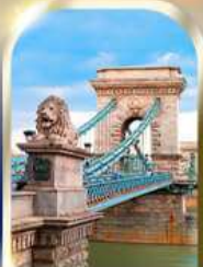
CHAIN BRIDGE BUDAPEST