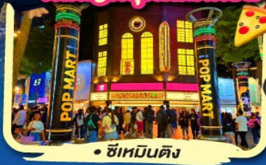
• ซิเหมินตง