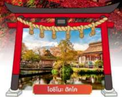
โคมิโนะ ฮัตโต

เดินทางโดยสายการบิน : ไทยแอร์เอเชียเอ็กซ์