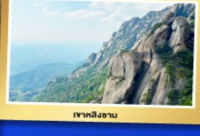
เขาหลิงซาน