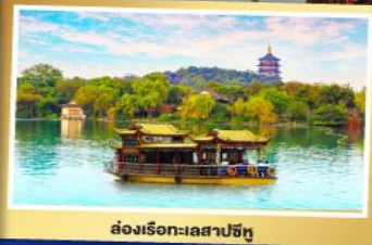
ส่องเรือทะเลสาบซีหู