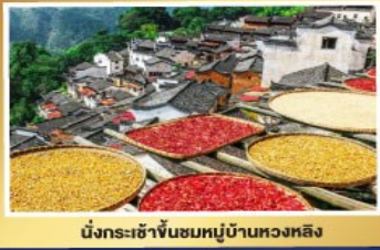
นั่งกระเช้าขึ้นชมหมู่บ้านหวงหลิง