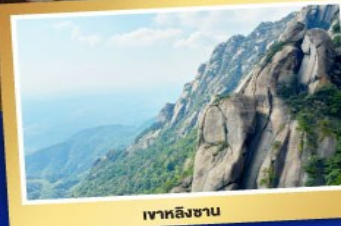
เขาหลิงซาน