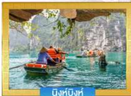
นิงห์บิ่งห์