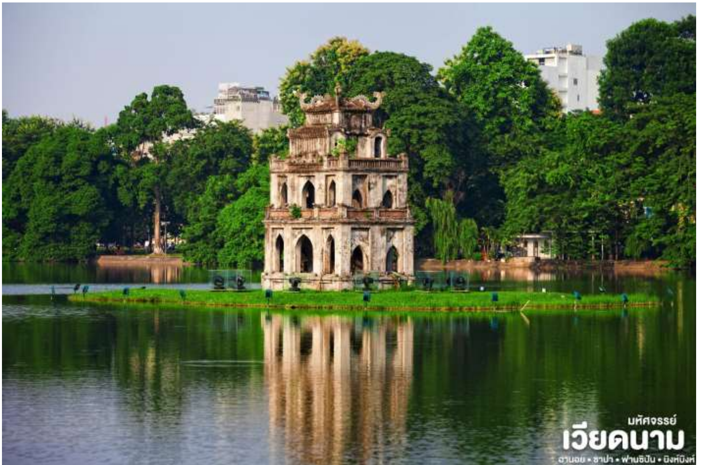
มทศจธรมย์ เวียดนาม ฮานอย • ฮาป๋าง • ฟานซิปัน • บิ่งหิ่งห์