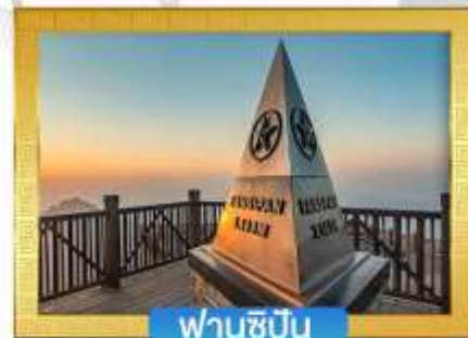
ฟานซีปิน