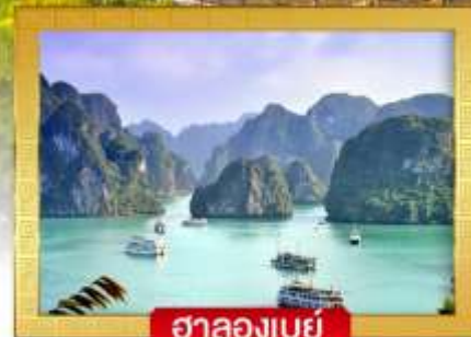
ฮาลองเบย์