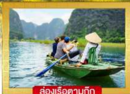
ล่องเรือตามก๊ก