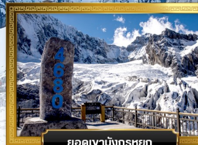
ยอดเขามังกรหยก