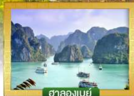
ฮาลองเบย์