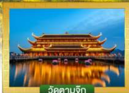
วัดตามจุก