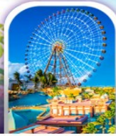
เมืองแฟนตาซี