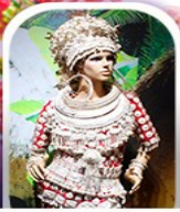
หมู่บ้านชนเผ่า