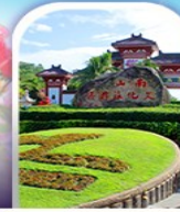
อุทยานหนานซาน