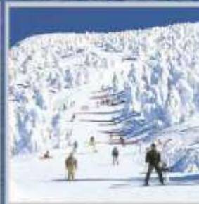
"ZAO SKI RESORT"