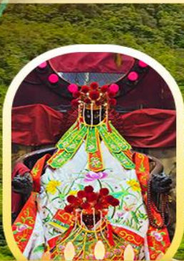
เจ้าแม่กวนอิมฮ่องฮำ