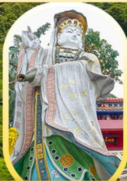
วัดเจ้าแม่กวนอิมรี พลัสเซนย์