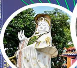
เจ้าแม่กวนอิม รัชกาลที่ ๖